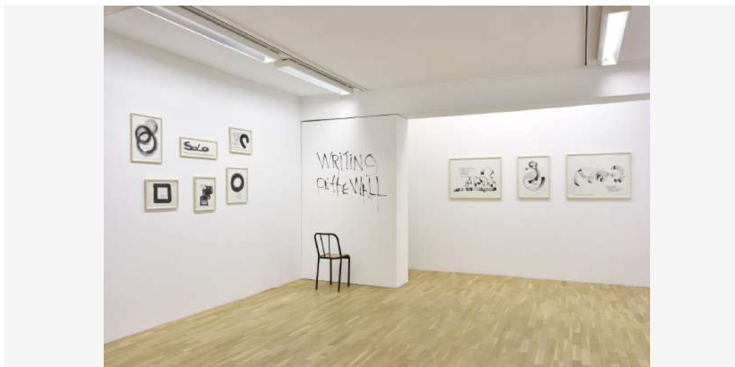
Carolyn Carlson, vue de l'exposition. Galerie Isabelle Gounod, Paris, 2020.

En juin 2017, le musée La Piscine de Roubaix inaugurait un cycle de trois expositions en France présentant pour la première fois au public l'œuvre graphique de la chorégraphe. Dans un format propre à chaque lieu, l'exposition fut présentée au musée Toulouse Lautrec d'Albi au printemps 2018, chez agnès b. à Paris en juin 2018 et à la Chapelle du Méjan d'Arles de novembre 2019 à février 2020. Le catalogue Writings on water accompagnait ce parti-pris, Writings on water /écrits sur l'eau, de la pièce éponyme de la chorégraphe.