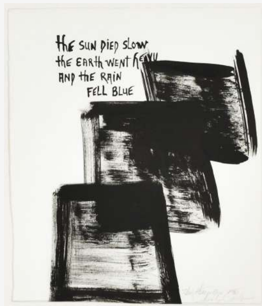
Carolyn Carlson, Slow heavy and blue , 1980. Encre de Chine sur papier vélin. 28 x 24 cm. Courtesy Carolyn Carlson & Galerie Isabelle Gounod.

En juin 2017, le musée La Piscine de Roubaix inaugurait un cycle de trois expositions en France présentant pour la première fois au public l'œuvre graphique de la chorégraphe. Dans un format propre à chaque lieu, l'exposition fut présentée au musée Toulouse Lautrec d'Albi au printemps 2018, chez agnès b. à Paris en juin 2018 et à la Chapelle du Méjan d'Arles de novembre 2019 à février 2020. Le catalogue Writings on water accompagnait ce parti-pris, Writings on water /écrits sur l'eau, de la pièce éponyme de la chorégraphe.