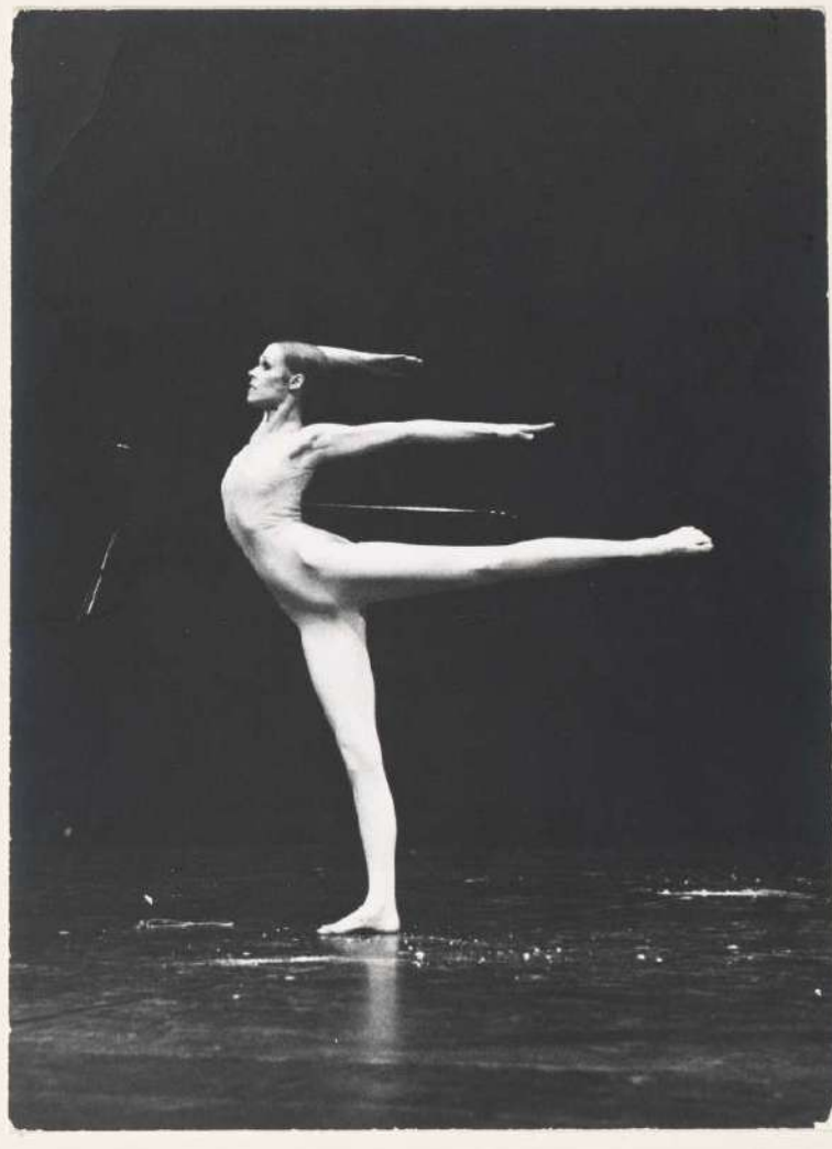
Carolyn Carlson dans "Les Fous d'or", 1975, photographie de Claude Lê-Anh. Exposition Carolyn Carlson à la BnF

Un quatrième chorégraphe entre sous la Coupole. Au cours de sa séance plénière de ce mercredi 2 décembre 2020, l'Académie des beaux-arts a élu Carolyn Carlson au fauteuil IV de la section de chorégraphie.